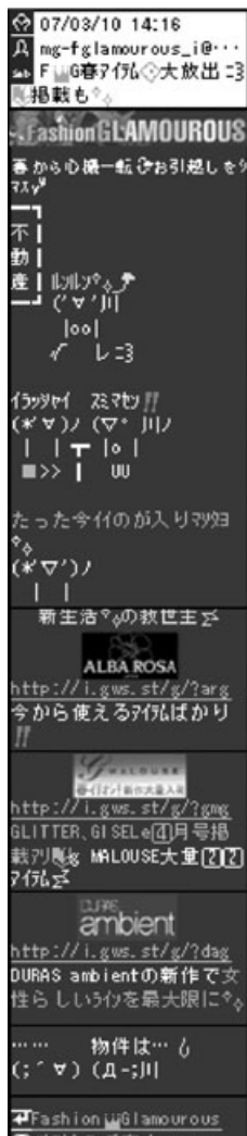
〔図3〕「楽天市場」のメルマガ。メールなのに御社のサイトより充実してませんか？メルマガ登録ページ！